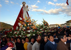
Huamachuco expresa una profunda fe en su Santa Patrona La Virgen de la Alta Gracia