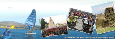
"HUAMACHUCO, destino turístico de la Macrorregión Norte"